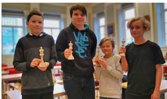
Alla klassegrare Blixt o Dunder 2019.